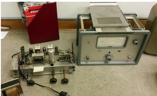
Enkele van de sinds maart gedoneerde apparaten.

Bezoekers van de open dagen op 18 en 19 april kwamen niet alleen kijken maar brachten ook wat mee. Zo kregen we (voor de onderdelen) een Philips buisvoltmeter, een zelf gebouwde ontvanger, diverse documenten en foto's, en een luidspreker en kiezer van de draadomroep.