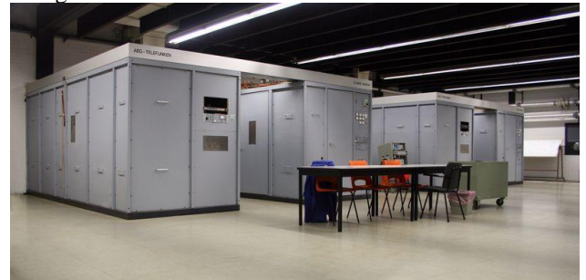
Links de zender van Radio 5 en rechts de reserve zender

Eén van de zenders is de reserve, bij storing van een bedrijfszender wordt de reserve zender automatisch op de goede frequentie afgestemd en met het antennesysteem verbonden. De uitgang van de defecte zender wordt dan verbonden met een kunstantenne, dit is een weerstand van 50 Ω die geschikt is om het uitgangsvermogen van de zender in warmte om te zetten. Zo kunnen reparaties en testen worden gedaan terwijl de uitzendingen gewoon doorgaan.