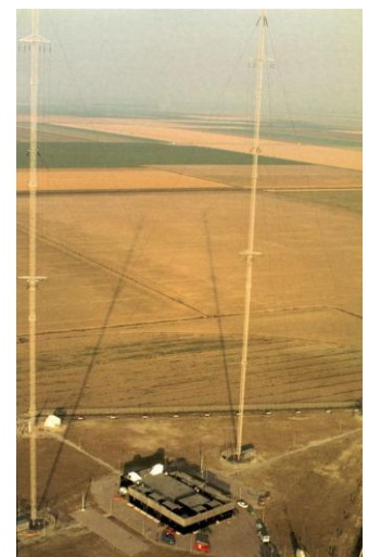
Het zendstation in 1979, het is dan in proefbedrijf

Na de frequentieconferentie van 1975 in Genève mocht Nederland met veel groter vermogen gaan uitzenden op de frequenties 747 en 1008 kHz. Het zendstation Lopik, waar vanaf 1940 op de middengolf wordt uitgezonden, was geen geschikte plek om nieuwe, veel grotere zenders, te plaatsen. Onderzoek gaf aan dat de nieuwe polder Zuidelijk Flevoland geschikt was om heel Nederland te verzorgen, met een kleine steunzender in Zuid-Limburg. In Flevoland werd op 22 maart 1978 de eerste paal geheid voor de bouw van een groot modern middengolf zendstation, dat 24 april 1980 door de staatssecretaris mw. Smit Kroes is geopend. Het zendstation was dan al enige tijd in (proef)bedrijf.